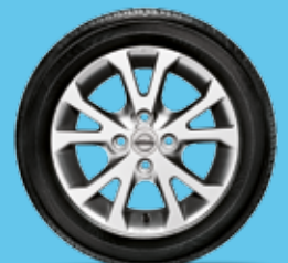
Fragen Sie Ihren NISSAN Händler nach dem Zubehörprogramm für den PIXO.