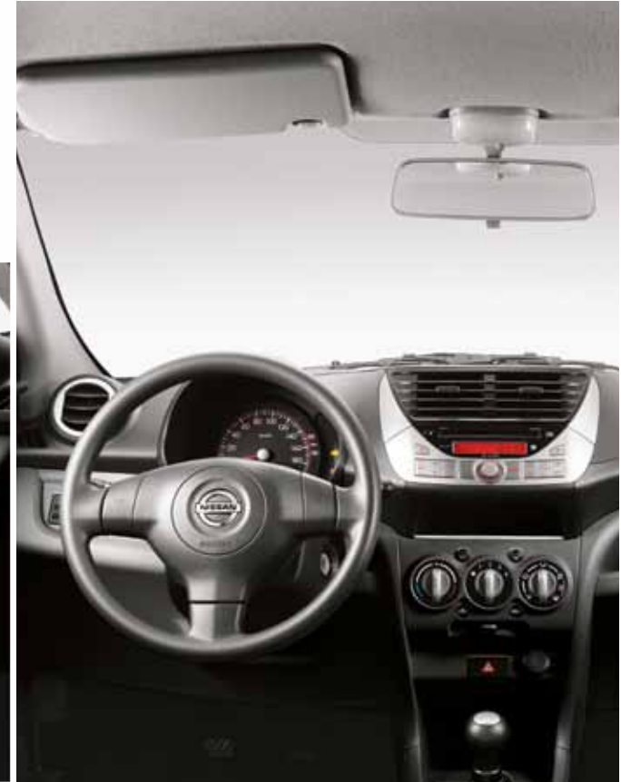
Neuer abblendbarer Innenspiegel

Gesamtverbrauch l/100 km: kombiniert 5,1– 4,3; CO 2 -Emissionen: kombiniert 118–99 g/km (Messverfahren gem. EU-Norm); Effizienzklasse: D–C. Durchschnittswert CO 2 -Emissionen der Personenwagen in der Schweiz: 159 g/km.