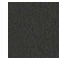
LE - Leder Graphite