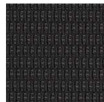
XE - Graphite