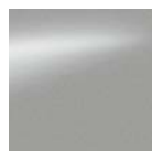
Silver - KLO / M