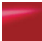
Solid Red - Z10 / S