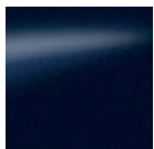
Blue - BW9 / M