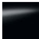
Black - GNO / M