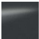
Blue Grey - KAP / M