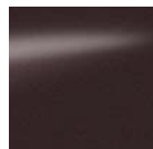
Black Pepper - NAF / M