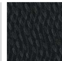
LE - Graphite